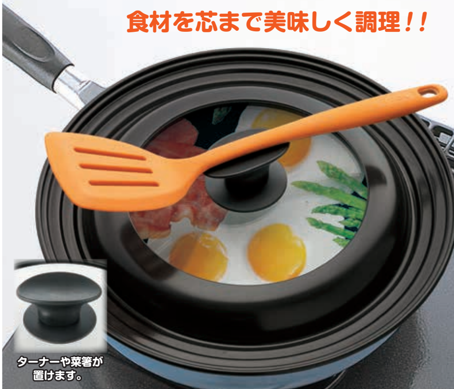
ターナーや菜箸が置けます。